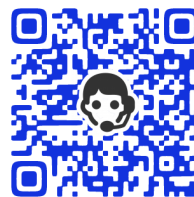
事前登録フォーム (ベトナム語相談用)

左下のQRコードを読み取って「事前登録フォーム」に、相談したい内容、住んでいる地域、2月15日当日にメッセージや電話でお話できる時間帯など、事前の予約をお願いしています。カトリックのベトナム人司牧者、信徒のみなさんが、相談者と専門家のあいだの通訳をお手伝いします。周囲のみなさんに、ぜひお知らせください！