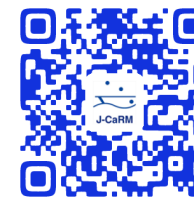
J-CaRM のお知らせページ