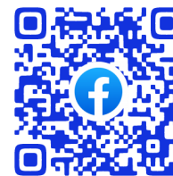
ホットライン Facebook ページ